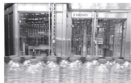
Dolumun yapıldığı üretim aşamasında bakteri oluşumunu önlemek için ameliyathane teknolojisi kullanılıyor.

öngörülüyor. 2012 TÜİK verilerine göre ihraç edilen ambalajlı su üretimi, 173 bin 469 tona ve 27 milyon 644 bin 100 dolar ciroya ulaştı. Bu yıl kişi başı ortalama tüketimin; 54 litre pet ve 84 litre damacana olmak üzere toplam 138 litre olarak gerçekleşmesi bekleniyor.